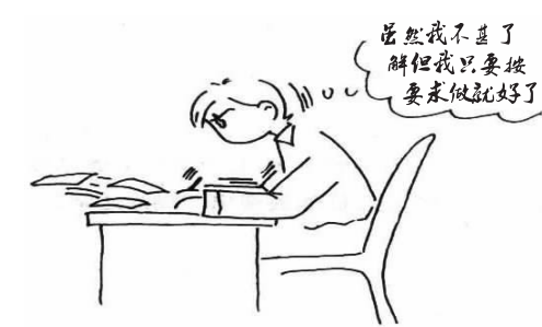
身为基层,有这样的态度是颇为难得的。执行力,后理解,实则为“糊涂之智慧”,才是正确的做法

客人用没有用过,床单被罩都要剥下来,一趟一趟送到洗衣房去,而且是每个屋子送一次。能不能把所有房间的床单被罩都剥下来,一起送到洗衣房,这样工作效率不是大大提高了吗?