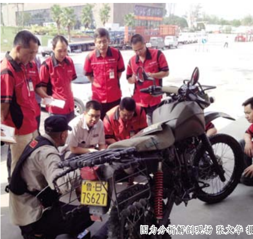
鑫源集团总部

骑车的还是坐车的都是提心吊胆,听到一点异响便马上停车检查,一路上战战兢兢,磕磕绊绊的总算到了贵州遵义。为了旅途的安全,我们决定将车辆做一次彻底检查。当时有一个维修配件需要到重庆生产厂家调货,可一等就是 4 天。于是决定拨打鑫源公司官网公布的电话,欲解胸中的怨气,不知何故,电话一直未打通,无奈之下只好来重庆生产厂家讨个说法。