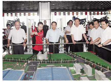
图为鑫大集团董事长向马副市长介绍鑫源规划