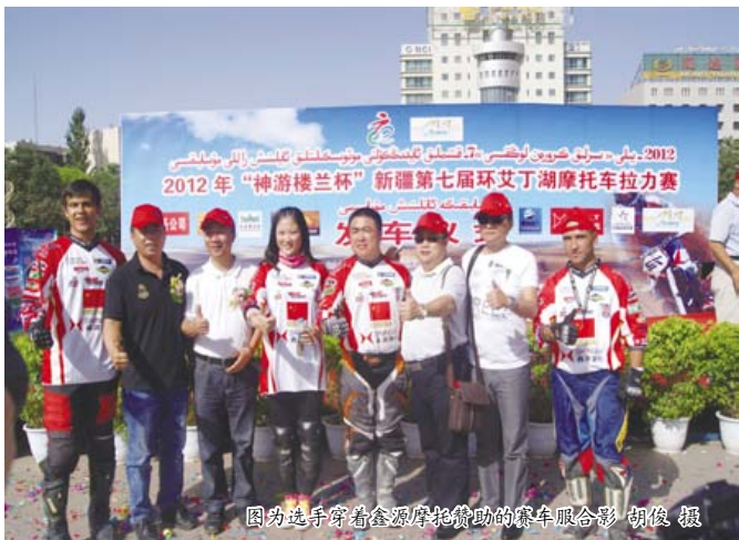
图为选手们穿着鑫源摩托参赛的集体合影

一开始宣传 QC 小组的时候,大家都对这项活动不以为然,大部分人都觉得这只是一个形式,涂装车间的 QC 小组先把各工段骨干组织起来,从基础抓起。第一步是统计方法的基础知识,即常用的统计方法在 QC 小组活动中的应用、QC 小组的活动程序、PDCA 循环要求等。为了帮助大家理解和记忆,培训师都精心准备课件,并尽量结合案例深入浅出地讲解。