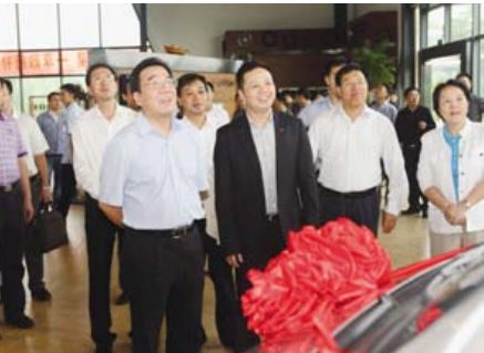
图为国家人社部信长星副部长(左一)参观连锁经营体验中心