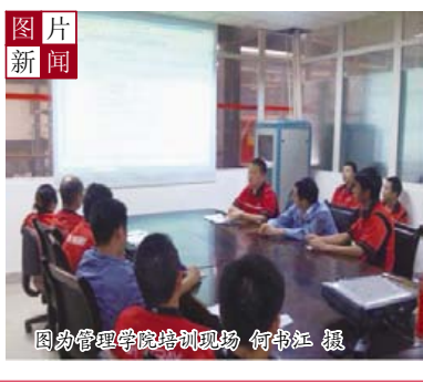
鑫源管理学院现场培训

得到这一消息后,全体相关人员迅速来到现场,热诚地与我们一道,不厌其烦地寻找问题。董事长当即定下把它作为质量教育案例,