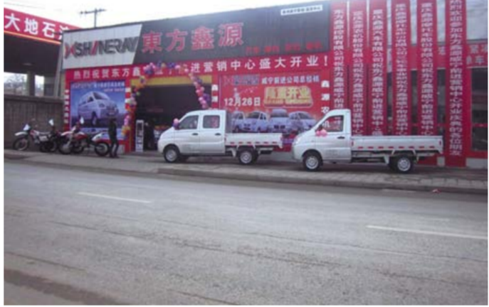
图为开业现场

事长陈进，东方鑫源威宁连锁加盟店总经理曾刚荣，东方鑫源重庆连锁营销股份有限公司营销管理部黄德军，当地 20 余个乡镇摩托车农机经销商参加了开业典礼，当天零售汽车 3 辆，摩托车 2 台，签订乡镇合作合同 6 份。向 2 下发摩托车订单 60 台。